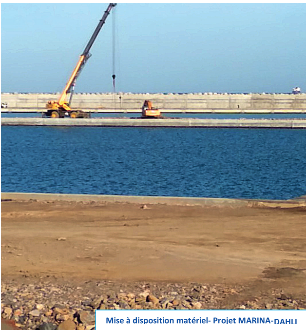
Mise à disposition matériel- Projet MARINA-DAHLI

Pour tout type de projet, BINAMA Sarl, propose ses services de la mise à disposition d'un personnel hautement qualifié dans les domaines du Génie civil, installation et maintenance des équipements énergétique (électrique, électromécanique, photovoltaïque) tel que les ingénieurs, superviseur, métresseurs vérificateurs, architectes, câbleurs, monteurs, instrumentiste, charpentiers,...etc.