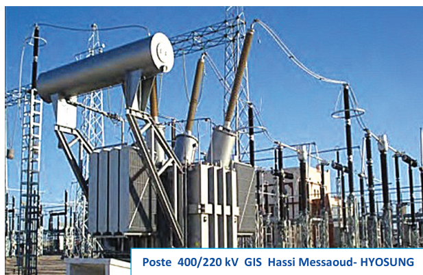
Poste 400/220 kV GIS Hassi Messaoud- HYOSUNG