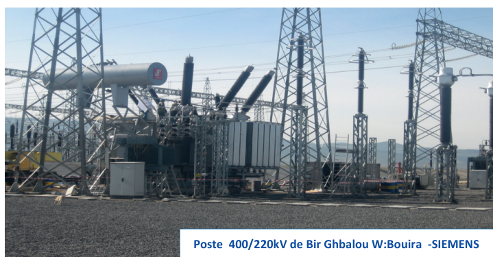
Poste 400/220kV de Bir Ghalou W: Bouira -SIEMENS

Grâce à la multitude des projets réalisés, BINAMA détient un savoir-faire attesté par ses clients tant locaux qu'étrangers, dans le domaine des installations des équipements énergétiques, lui permettant d'assurer: