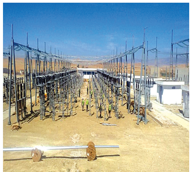
Testing et commissioning, montage électrique-poste BOUGHEZOU-L&T

Pour répondre aux besoins de certains clients, BINAMA propose la location d'une large sélection de matériel tel que : camions, clark, nacelles, camions-grues, groupes électrogènes, centrales à béton, véhicules légers, échafaudage, et autres, afin de faciliter l'achèvement de vos travaux.