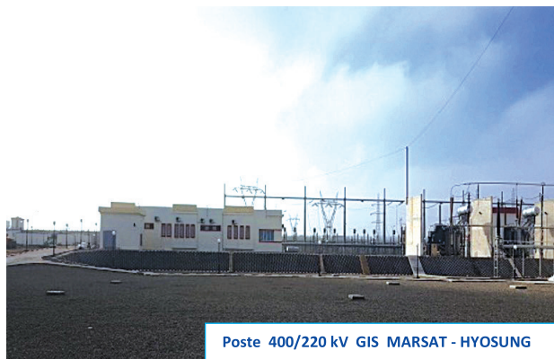
Poste 400/220 kV GIS MARSAT - HYOSUNG