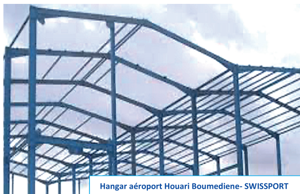
Hangar aéroport Houari Boumediene- SWISSPORT

BINAMA assure la mise en place des ossatures métalliques pour les installations industrielles et bâtiment.